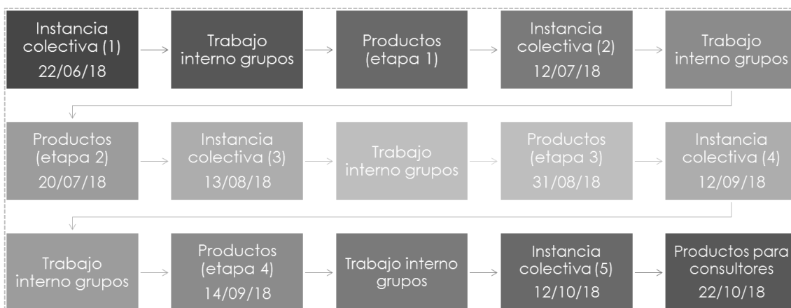
CUADRO 3. RECORRIDO FASE 1